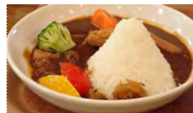
↑ 富士山カレー (サファリパーク)